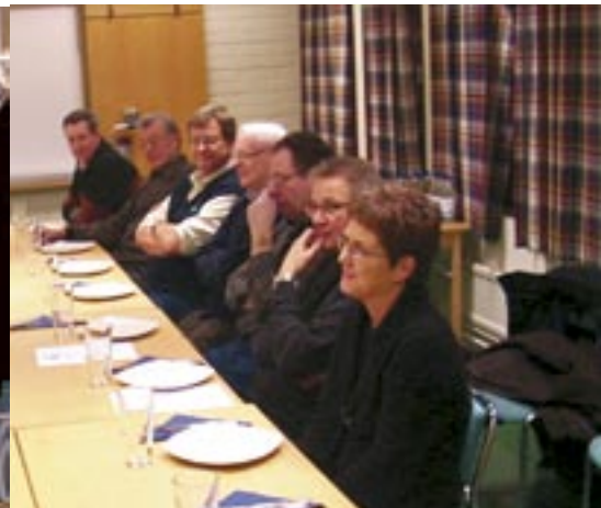
Årsmötesdeltagarna väntar på Taco-buffen.

Kontaktmännens rapport påminde om den tuffa verklighet som vår bransch befinner sig i där materialprishöjningar och sparprogram tillhör vardagen.