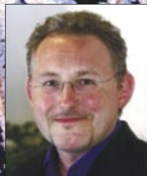
Medieledarna drar igång som egen förening den första april.