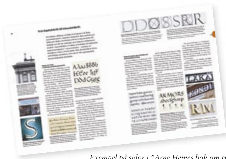
Exempel på sidor i "Arne Heines bok om typografi"