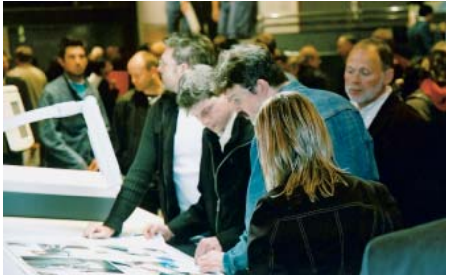
Granskning av provtryck fanns det många möjligheter till.