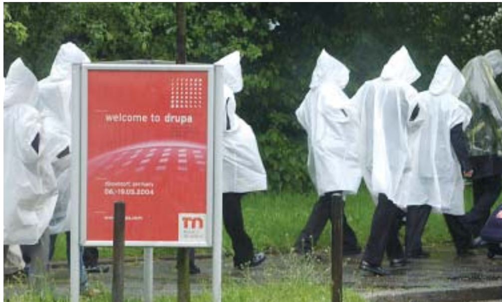
Det dryper om drupa. Regn, gråväder och rekordkyla lyckades ändå inte helt lägga sordin på feststämningen.

som mullrar igång och sprider den karaktäristiska drupadoften av trycksvärta, grillad korv och rakvatten.