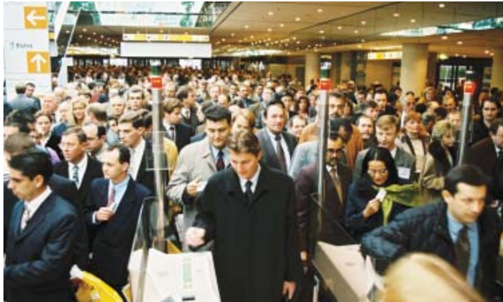
Knökfullt. Ändå beräknas cirka tio procent färre personer besöka drupa 2004 än föregående drupiad

Nästan 2000 utställare från 52 olika länder ställer ut på drupa i år. De dryga 161 400 kvadratmeterna, fördelade på 17 utställningshallar, känns precis som tidigare år överväldigande. Storleken gör mässan omöjlig att överblicka. En redaktör beskrev hur han skulle vara på drupa samtliga utställningsdagar och ändå inte hinna se allt. Här finns allt från sugkoppar i olika storlekar till jättelika färgpressar