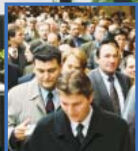
Färre besökare men fullt ändå